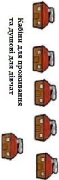
Кабіни для проживання та душові для дівчат